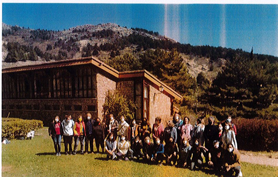
Mindfulness y autocompasión, organizado por la empresa Global C