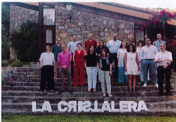
Reunión del Equipo de Gobierno de la UAM