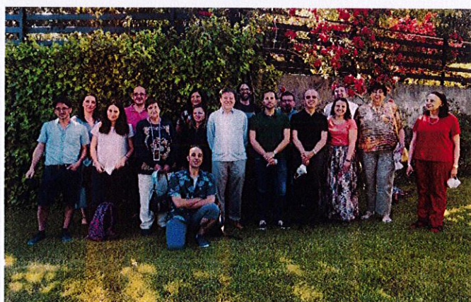
Grupo de Anatomía, F. Medicina

La Cristalera ha seguido adaptándose a los cambios en los protocolos anti-Covid que las autoridades sanitarias han ido modificando en los últimos meses según evolucionaba la crisis sanitaria. La distancia de seguridad, el aforo limitado, el uso de la mascarilla obligatoria, el gel desinfectante, la desinfección de espacios y la ventilación, continúan vigentes en la residencia para garantizar la seguridad de trabajadores y clientes.